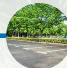
Áreas de estacionamiento