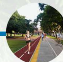
Pista de jogging