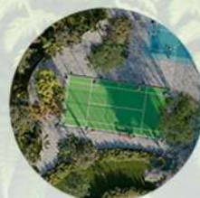
Cancha de padel