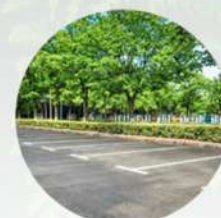
Áreas de estacionamiento