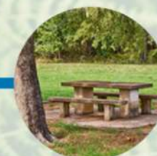
Área de picnic