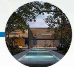
Canal de nado