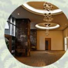
Salón de eventos