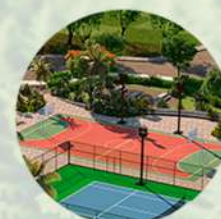
Cancha de usos múltiples