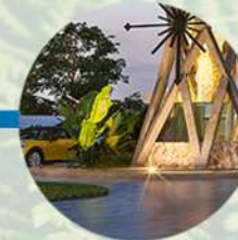
Caseta de vigilancia