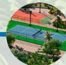
Cancha de tenis