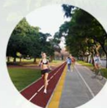
Pista de jogging