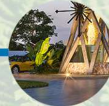
Caseta de vigilancia