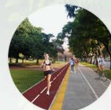
Pista de jogging