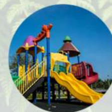
Área de juegos junior