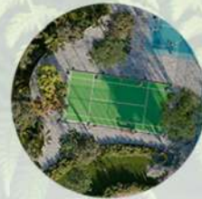
Cancha de padel