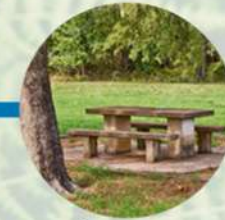
Área de picnic