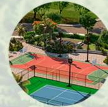
Cancha de usos múltiples