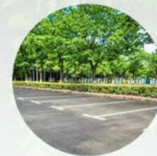
Áreas de estacionamiento