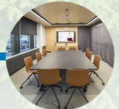
Sala de juntas