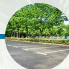
Áreas de estacionamiento