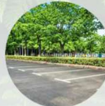
Área de estacionamiento