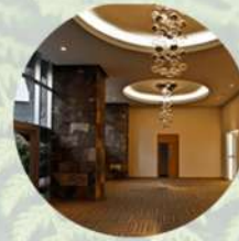
Salón de eventos