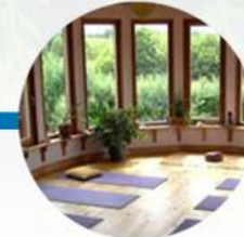
Área de yoga