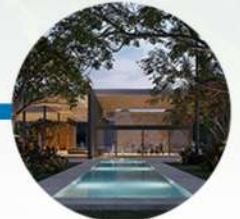
Canal de nado