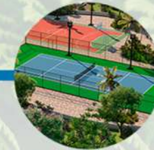
Cancha de tenis