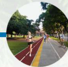
Pista de jogging