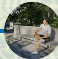
Jardín de lectura